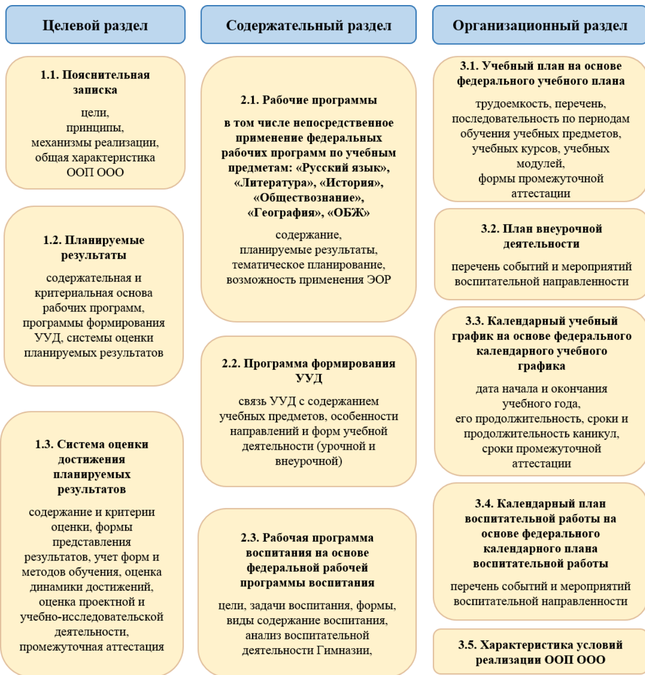
Схема 2. Структура ООП ООО